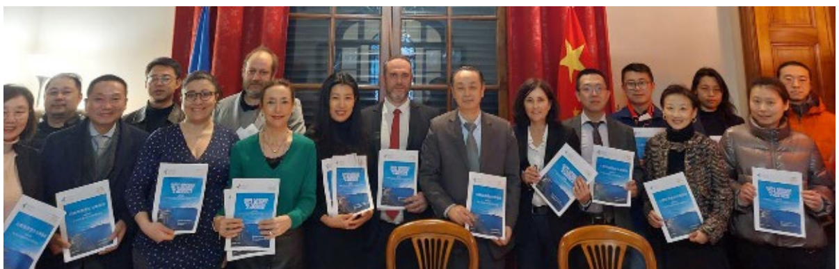
Les équipes du Consulat de Chine et du Barreau de Marseille pour le lancement du guide ce vendredi 19 janvier

Fort d'une culture de l'hospitalité vieille de plusieurs millénaire, le peuple phocéen et les avocats du barreau de Marseille, honorent l'amitié entre les peuples français et chinois et se réjouissent des coopérations à venir.