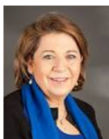
Corinne LEPAGE (vidéo) Avocate, ancien Ministre Présidente de l'Association des Amis de la DDHu